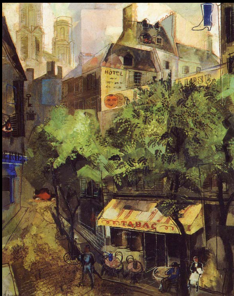
Юрий Анненков Латинский квартал 1925 ►