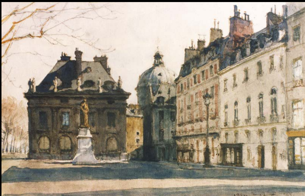
Александр Бенуа | Набережная Малаке | Париж | 1929