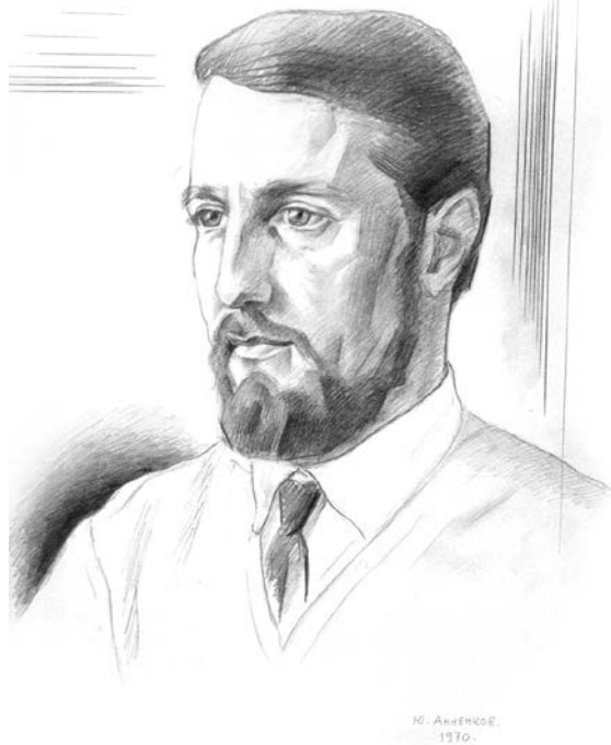
Юрий Анненков. Портрет Ренэ Герра. 1970

А дальше — совершенно неожиданное: на высоких полках — зелёные, цвета коры платана, узорчатые, с шутивными, поучающими надписями штофы эпохи Александра III, белого стекла штоф «Александр Пушкин», выпущенный к столетию со дня рождения поэта; за штофами в ряд — поддужные колокольцы с валдайских троек, что своим чистым и сильным, на сотни вёрст, звоном пронзят любую метель, не дадут пропасть. Певкая,