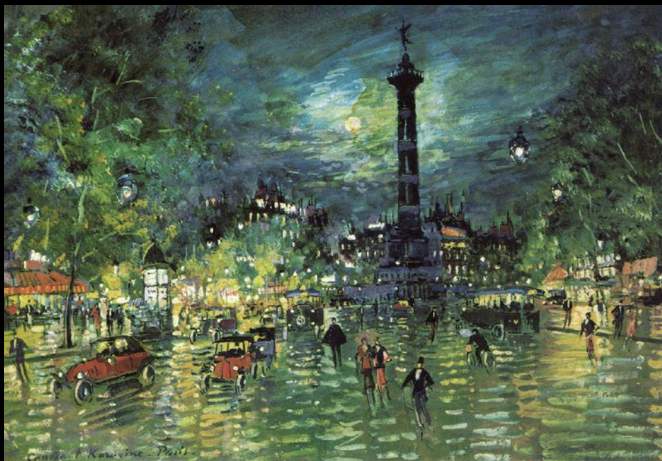
Константин Коровин Бастилия 1928 ▲