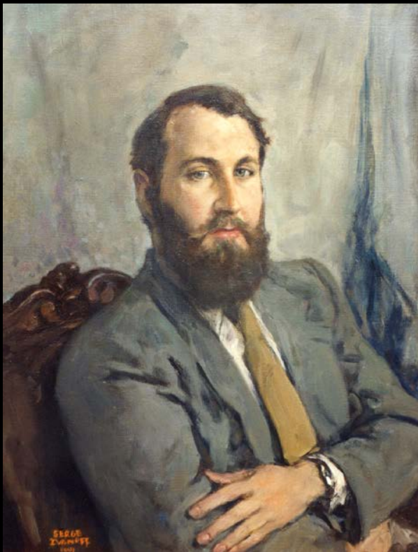
Сергей Иванов | Портрет Ренэ Герра | 1979

Картины из коллекции французского филолога-слависта и коллекционера Ренэ Герра .